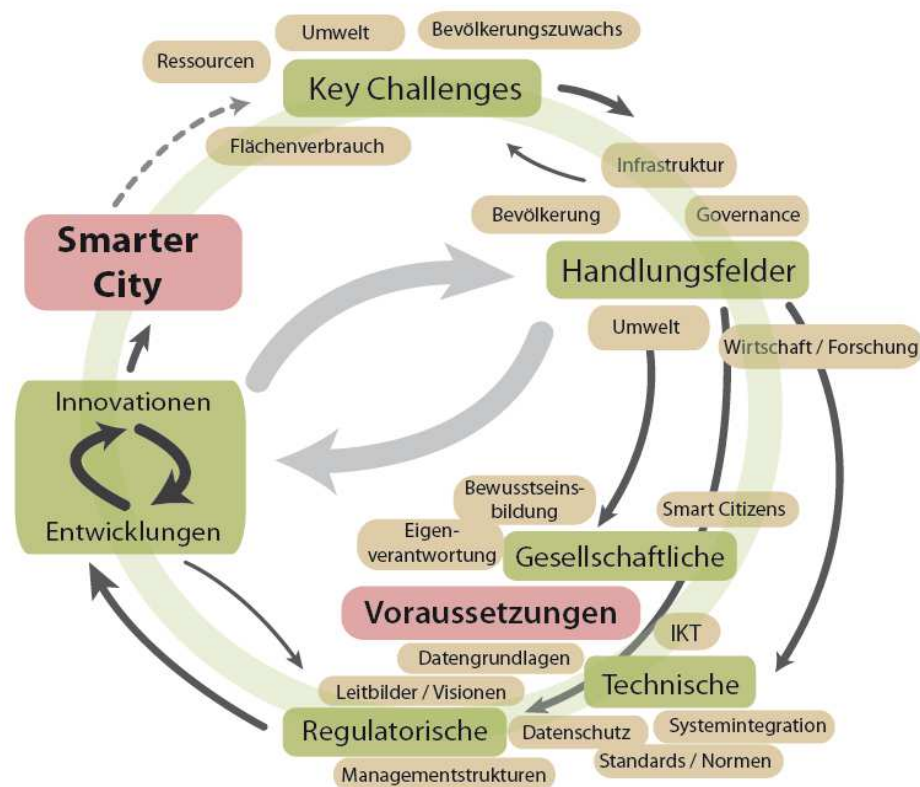
Abbildung 3: Smarter-City-Modell.

EinwohnerIn, Veränderungen im demographischen Gefüge (Überalterung) sowie soziale Probleme wie z. B. Segregation oder auch wirtschaftliche Schwierigkeiten (Mandl 2013). Bei der Analyse der Key Challenges gilt es darauf zu achten, dass es zahlreiche Wechselwirkungen und Abhängigkeiten der Herausforderungen untereinander gibt. Erschwerend kommt hinzu, dass sich die Herausforderungen bzw. deren Lösungsstrategien häufig widersprechen. Eine Stadt mit starkem Bevölkerungswachstum sieht sich der Herausforderung gegenüber, für die Bevölkerung neuen Wohnraum zu schaffen – dies geschieht, klassischerweise auf Kosten des Naturraums, indem Grünflächen verbaut werden. Seltener wird der smarte Weg gegangen, indem bestehender Wohnraum verdichtet oder gar Wohnraum in Stadtzentren revitalisiert wird. Unzählige solcher stark voneinander abhängigen bzw. sich widersprechenden Herausforderungen und Lösungsansätze gibt es in Städten. Eine Smart City zeichnet sich dadurch aus, dass diese Wechselwirkungen erkannt, Lösungen gefunden werden und die Probleme von unterschiedlichen Seiten mit einem ganzheitlichen Ansatz zu lösen versucht werden.