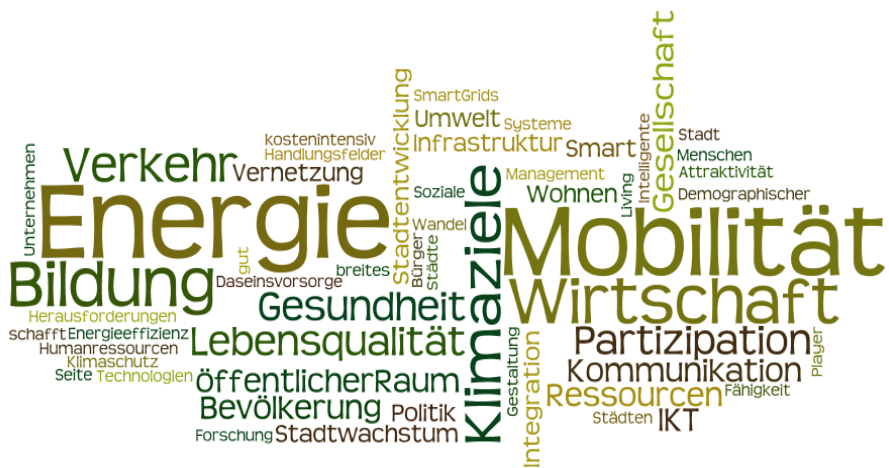
Abbildung 4: Smart-City-Handlungsfelder. Quelle: Mandl 2013, S.34