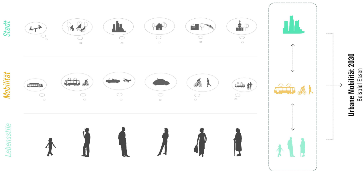
Fig. 1: Forschungsansatz des Forschungsprojektes „Neue Mobilität für die Stadt der Zukunft“

sind zwar innovative Ansätze für fußgänger- und radverkehrsfriendlye Straßenräume enthalten, doch eine konsequente planungspraktische Umsetzung bleibt bisher aus bzw. findet nur selten statt.