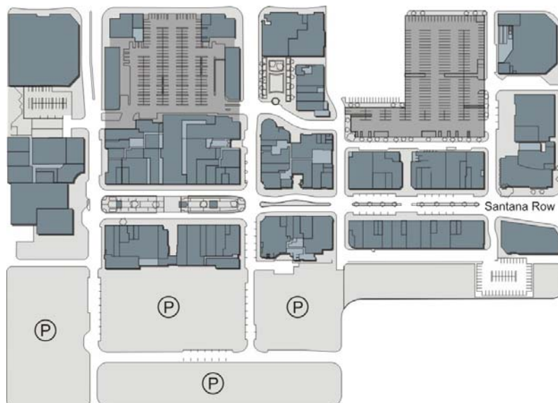
Abb. 04: Erdgeschoss Santana Row (eigene Darst.).

Entlang der Santana Row 144 sind sowohl Verkaufsflächen im Erdgeschoss mit exklusiven Marken besetzt, wie auch viele Gastronomieeinrichtungen angeordnet. Diese haben in den letzten Jahren einen immer größeren Anteil eingenommen 145 (Abb. 04). Entwickelt wurde das Projekt unter dem New Urbanism, jedoch fand keine Beteiligung des CNU statt. Es folgte ein Masterplan in Abstimmung mit der Stadt. Eine Charrette 146 in Verbindung mit einer langfristigen Partizipation der Anwohner war im Planungsprozess nicht vorgesehen und konnte auch nicht bestätigt werden. Die Akzeptanz der Bevölkerung für das Areal wird von der Stadt im Nachhinein als gut eingeschätzt. Das ganze Gelände (inkl. Strassen) ist Privatbesitz des Investors und somit kein öffentlicher Raum, ist jedoch jedem zugänglich 147 und wird aus Sicherheitsgründen von der örtlichen Polizei kontrolliert.