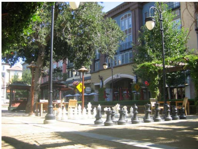
Abb. 03: Santana Row, Straßenansicht Santana Row.

Anstelle der Strip-Mall entstand ein Quartier mit einem großflächigen Einzelhandelsbereich (74.320m 2 VK) in den Erdgeschosszonen, einem Hotel 142 , Kinokomplex und über 1.000 Wohneinheiten 143 in den oberen Geschossen. Ein offenes, mit der Umgebung verknüpftes Straßenraster dient als Aufenthaltsbereich und Einkaufsstraße, welche qualitativ hochwertig gestaltet wurde und nach Aussage der Stadt mit städtischen Mitteln nicht finanzierbar gewesen wäre.