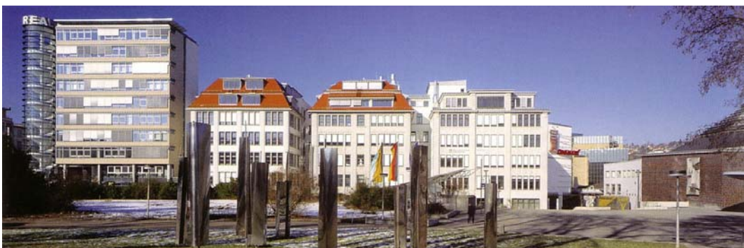
Abb. 05: Bosch-Areal, Blick über den Berliner Platz.

Das Bosch-Areal stellt sich heute als ein revitalisierter Gebäudekomplex dar, der sowohl kulturell als auch wirtschaftlich einen positiven Beitrag zur Stadtgestalt der Innenstadt leistet (Abb. 05). Es liegt im Zentrum der Stadt Stuttgart, Landeshauptstadt von Baden-Württemberg (Deutschland), und bildet den Übergang der Geschäfts- und Einkaufsviertel mit den Wohnbebauungen des Stuttgarter Westens. Aber die geschichtliche Entwicklung des Areals begann schon im Jahr 1900 (Marquart, 1997: 553). Der Name des Areals geht auf den Industriellen Robert Bosch zurück, der sich dort zur Firmengründung von den Architekten Carl Heim und Jacob Früh Gebäude mit nutzungsneutralem Grundriss errichten lies (Krisch, 2002: 32). Schon 20 Jahre später wurde der Firmensitz zu klein und die Produktion ins Umland verlegt. Nach den Kriegsjahren, die der Gebäudekomplex fast unbeschadet überstanden hatte, wurde das Gelände unter staatlichen Besitz bis zum Anfang der 1990er Jahren teilweise als Hochschulstandort und als staatlicher Verwaltungssitz genutzt (Marquart, 1997: 553). Nach längerem Leerstand und mehreren erfolglosen Umnutzungsversuchen wurde in einem städtebaulichen Ideenwettbewerb 1992 vom Preisträger Architekt Roland Ostertag die Erhaltung und Entwicklung der bestehenden Bausubstanz vorgeschlagen (Krisch, 2002: 33). Einige Jahre später lobte die Stadt erneut ein Investoren-Auswahlverfahren aus.