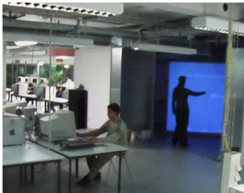
Abb. 3: ‚Open Wall‘ im casino IT der Universität Stuttgart

Computerkurse (CAAD, Desktop-Publishing, Bild- und Videobearbeitung, etc.) sind bei Studierenden nach wie vor sehr gefragt. Aufbauend auf die darin erworbenen Kenntnisse können ihnen in speziellen Kursen (VRML, VR-Software, Programierkurse) die Grundlagen für die VR-Produktion vermittelt werden. In Seminaren und Projekten ist es Studierenden dann möglich, sich weitergehend mit spezifischen Fragestellungen der Schnittstellen Mensch, Architektur, Stadtplanung und Virtuelle Realität zu beschäftigen. Ein Konzept für eine VR-Installation, auf dessen Basis beispielsweise die ‚Open Wall‘ (Single-Wall VR-System) am zentralen Computerpool der Fakultät für Architektur und Stadtplanung der Universität Stuttgart, dem casino IT, realisiert wurde, kann VR Projekte unterstützen und vereinfachen. Die Besonderheit der Open Wall (Abb. 3) liegt nicht nur in ihrer Technik, die aus einfachen Komponenten besteht, und daher zu einer Low-Budget Lösung zusammengestellt werden kann. Ihre Besonderheit