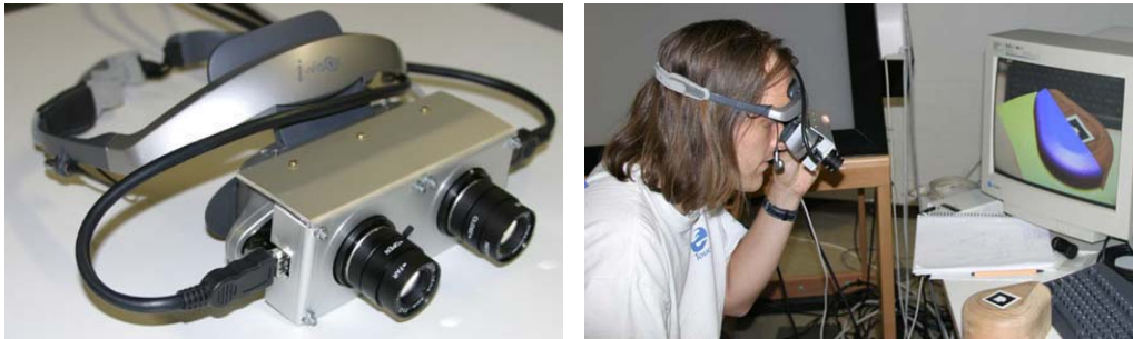
Abb. 1: Augmented Reality HMD Cy-Visor.

Die Augmented Reality (AR) kann als Spezialfall der VR gesehen werden. Bei AR werden computergenerierte Bilder mit der Wirklichkeit überlagert. Mit dem ARToolkit, einer AR-Open-Source-Software-Basispaket, entwickelt an der University of Washington [Billinghurst & Kato, 1999], lässt sich ein 3D-Modell in einen Videostream einer DV-Kamera integrieren. Werden spezielle sich voneinander unterscheidende Symbole (fiducial markers) in das Sichtfeld der Kamera gebracht, erkennt die Software über Video-Capturing die Marker und blendet relativ zu deren Position und Ausrichtung referenzierte Modelle in den Videostream ein. In Abb. 1 ist ein Head Mounted Display (HMD) zu sehen, an das zwei Kameras in Augenposition angebracht wurden. Mit diesem System lassen sich am Computer erzeugte Objekte sowie graphisch aufbereitete Informationen innerhalb der physischen Umgebung zwei- oder dreidimensional darstellen.