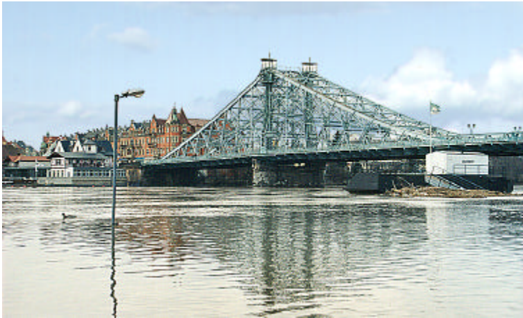
Abb. 1: Elbehochwasser 1999 in Dresden

Das Problembewusstsein für die Bedeutung des Hochwasserschutzes hat sich in Mitteleuropa vor allem durch die Katastrophen an Rhein und Oder in den letzten Jahren deutlich verstärkt. Diese „Jahrhundertereignisse“ haben gezeigt, dass allein technische Maßnahmen für ein umfassendes Hochwasserschutzkonzept nicht ausreichen. Die Internationale Kommission zum Schutz der Elbe (IKSE) weist - wie auch andere Organisationen und Institutionen - in einem Strategiepapier darauf hin, dass Hochwasser eine natürliche hydrologische Erscheinung sind und deshalb die natürlichen Überschwemmungsgebiete erhalten und auf geeignete Weise genutzt werden sollen (vgl. IKSE 1998). In diesem Zusammenhang spielen dezentrale Maßnahmen des vorbeugenden Hochwasserschutzes eine wichtige Rolle, um schließlich die Schadenspotentiale zu minimieren.