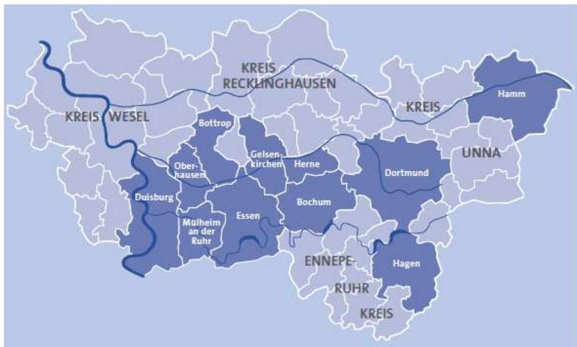
Abb. 1: Verbandsgebiet des RVR, Quelle: RVR 2012

Der Regionalverband Ruhr (RVR) ist ein kommunaler Zweckverband und setzt sich aus den elf kreisfreien Städten (Bochum, Bottrop, Dortmund, Duisburg, Essen, Gelsenkirchen, Hagen, Hamm, Mülheim a. d. Ruhr und Oberhausen) sowie den vier Kreisen (Ennepe-Ruhr-Kreis, Kreise Recklinghausen, Wesel und Unna) der Metropole Ruhr zusammen.