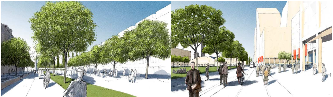
Abb. 1: Graz-Reininghaus, Perspektive Grünachse, Abb. 2: Graz-Reininghaus, Perspektive Esplanade und Stadtteilpark

2006 wurde kleboth lindinger partners von Asset One, dem Haupteigentümer der Liegenschaften in Graz-Reininghaus, beauftragt, eine umfassende Konzeption für die Entwicklung des Areals zu erstellen. Dabei hatten wir alle Freiheiten, allerdings unter einer Bedingung: Uns wurde ein striktes Verbot auferlegt, den Zeichenstift in die Hand zu nehmen. Stattdessen sollten wir die Stadt als solche umfassend neu denken.