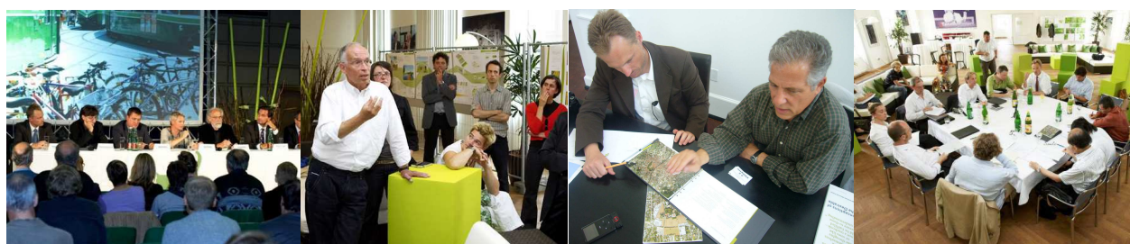
Abb. 9: Podiumsdiskussion ‘Mobilität für Graz-Reininghaus’

Die Besonderheit, dass hier ein ganzer Stadtteil neu errichtet wird, eröffnet zudem die Chance, eine eigene Community zu begründen. Das eröffnet im Speziellen neuen Geschäftsideen interessante Tätigkeitsbereiche. Zwei Beispiele: Selbstbewusste, engagierte Bürgerinnen und Bürger wünschen Alternativen zu öffentlichen Angeboten im Bereich von Betreuungs- und Bildungseinrichtungen; oder: der Wunsch nach Besitz eines Autos sinkt bei den jüngeren Generation, Besitz belastet und kostet. Eine tolle Chance für Car-Sharing-Angebote, Lieferservices, Mitfahrbörsen u.a.m.