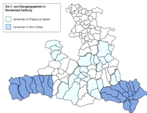
Graph 1: Land Salzburg, Darstellung der Zielgebiete, EU-Strukturfonds 2000-2006

Die Förderzielgebiete des Landes Salzburg für die Ziel 2 Förderungen der EU-Strukturfonds 2000-2006 liegen ausschliesslich in den südlichen Bezirken und damit im ländlichen Raum.