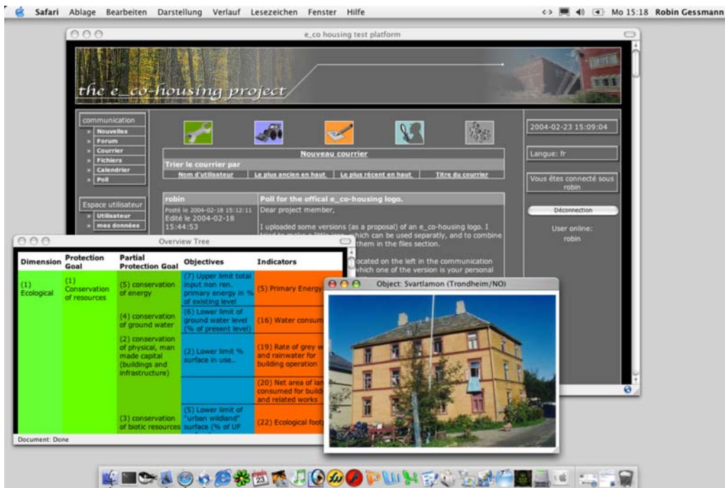
Abbildung 3: Kooperative Planungsplattform mit Integration der Ziele nachhaltiger Planung