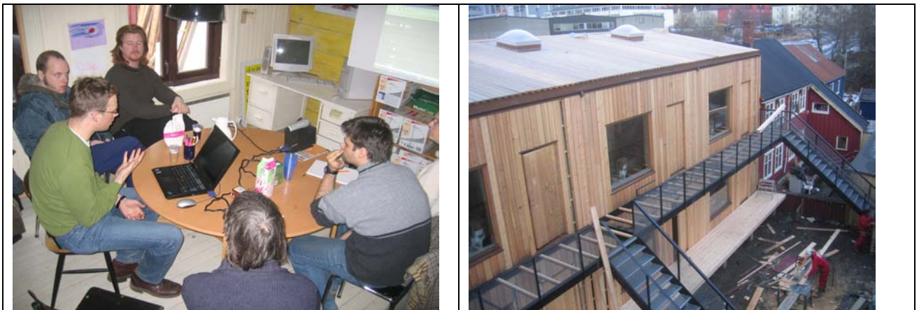
Abbildung 5: Kooperative Planungsansätze bei der Entwicklung einer Siedlung in Trondheim, Norwegen