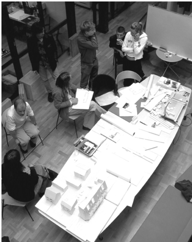
Abbildung 1: Kooperierende, partizipative Planung 5

Über die wesentlichen Ziele nachhaltiger Siedlungsentwicklung besteht weitreichend Einigkeit und auch bei den Indikatoren zur Messung der erreichten Qualität kann auf eine große Anzahl von Forschungsprojekten zurückgegriffen werden 1234 .