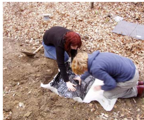
Fotos: Links: Beschädigte Lichtschranke im Nationalpark Donau-Auen; Rechts: Einbau einer Druckmatte (Fotos Arnberger)