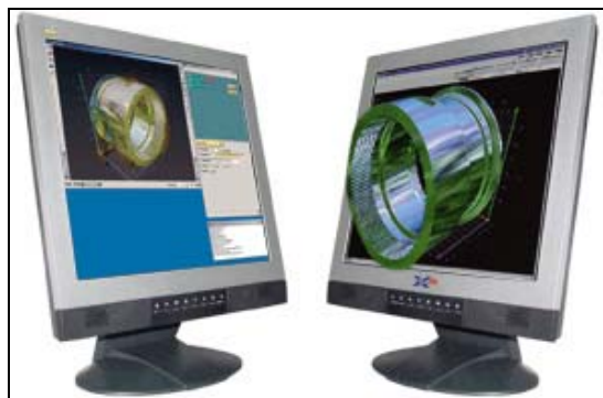
Abb.1: Auf X3D-OpenGL-Enhancer basierende, interaktive autostereoskopische Applikation, links: herkömmliches Display mit User Interface, rechts: autostereoskopische Visualisierung mittels Multiview-Parallax-Barrieren ( www.4d-vision.de bzw. www.opticalitycorporation.com )