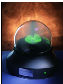
Abb.3: „Perspecta“ – erstes kommerzielles volumetrisches Display ( www.actuality-systems.com )