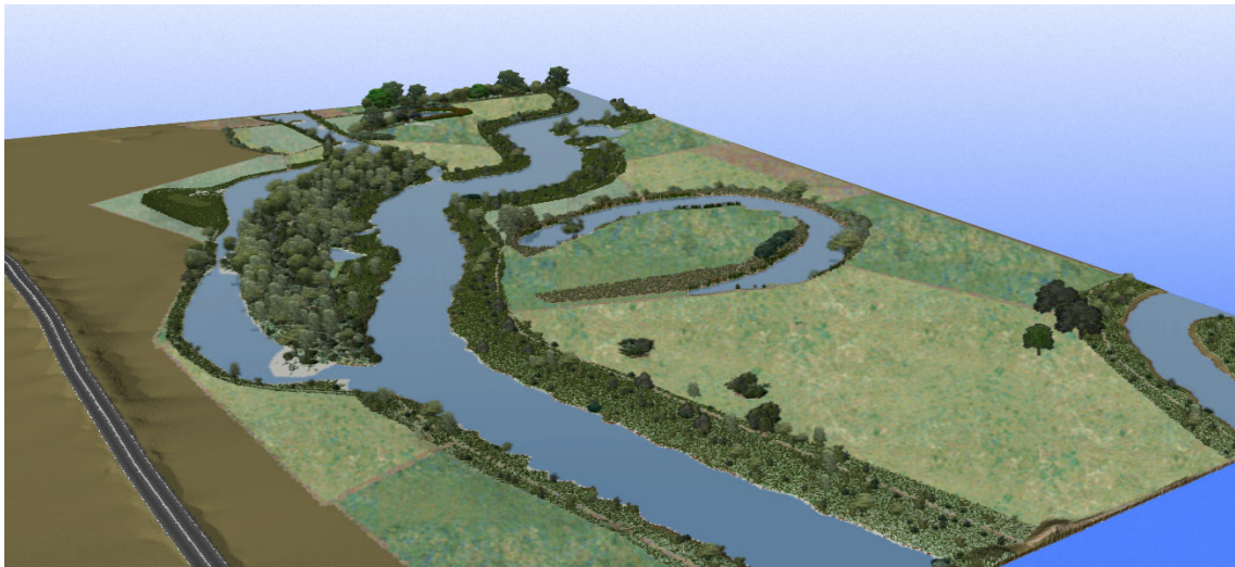
Abbildung 1: 3D-Visualisierung eines Gewässerabschnitts (BÜSCHER 2002)