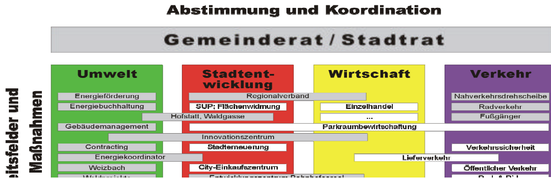
Abb 1: Evaluierung Ökoplans Weiz - Handlungsfelder und Zielgruppen (Österreichisches Ökologie-Institut 1999)